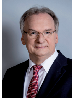
Dr. Reiner Haseloff Ministerpräsident des Landes Sachsen-Anhalt Prime Minister of the Federal State of Saxony-Anhalt